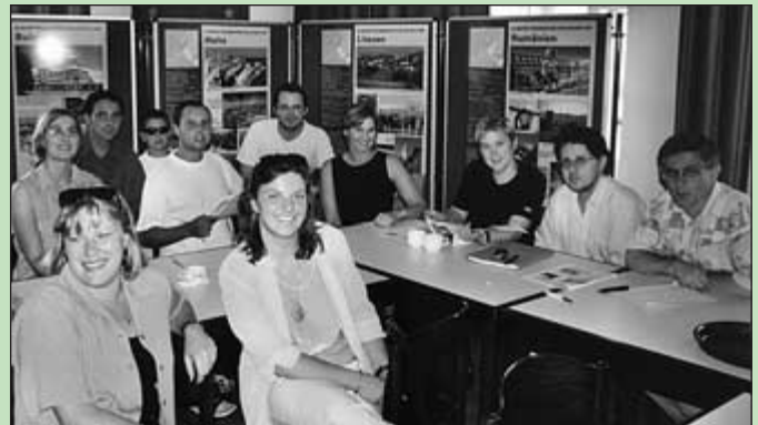
Bundesvorstandssitzung des BEJ/JEF Österreich am Sonntag, den 15. Juli 2001, auf Schloss Forchtenstein in Neumarkt (Stmk.)

Umsetzung der Beratungen sind genau so wichtig wie die Aufnahme von aktuellen Informationen und Diskussionen bei Tagungen.