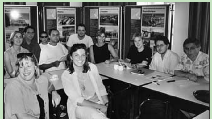
Bundesvorstandssitzung des BEJ/JEF Österreich am Sonntag, den 15. Juli 2001, auf Schloss Forchtenstein in Neumarkt (Stmk.)

Umsetzung der Beratungen sind genau so wichtig wie die Aufnahme von aktuellen Informationen und Diskussionen bei Tagungen.