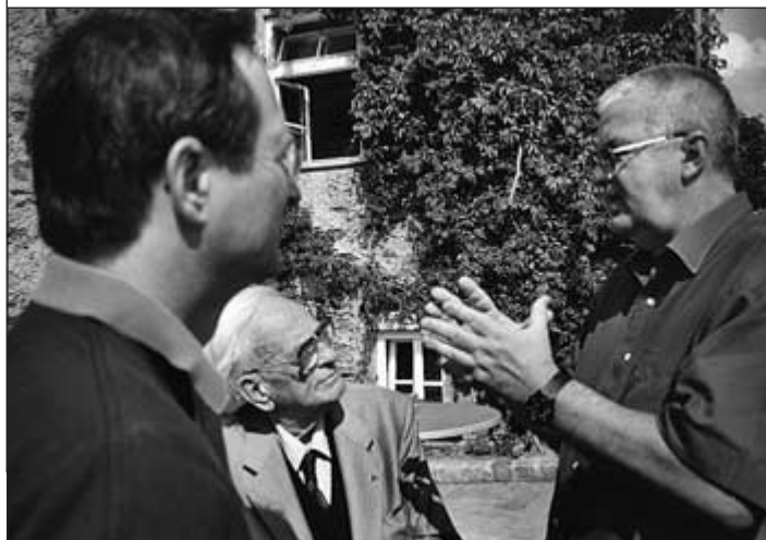
Die Sozialpartner: Präsident Dr. Leitl (li.) und Nachtnebel (re.) beim Gedankenaustausch im Schlosshof von Forchtenstein.

Christoph Leitl wies in der Diskussion darauf hin, dass auch die Grenzgebiete von der Erweiterung profitieren könnten. Betriebe siedeln sich an, neue Arbeitsplätze werden geschaffen. Die Vorteile der Erweiterung sind vor allem im Außenhandel erkennbar und durchaus wechselseitig: So sei der österreichische Außenhandel mit den MOE-Ländern in den zurückliegenden fünf Jahren um 100 Prozent gestiegen. Umgekehrt konnten diese Länder ihre Exporte nach Österreich sogar um 130 Prozent steigern.