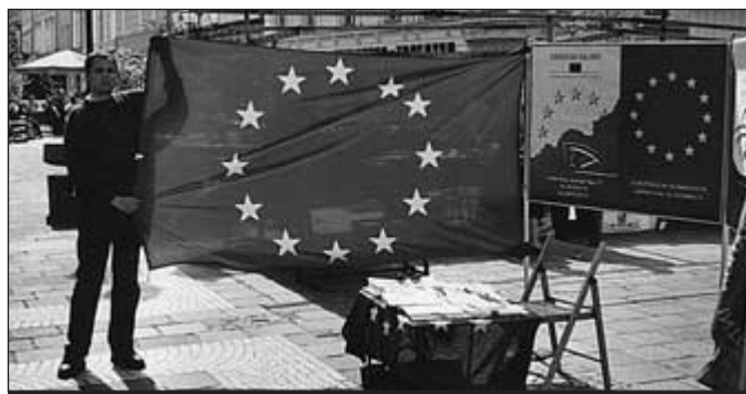
Ebenfalls am 8. Mai 2002 informierten wir die Bevölkerung am Stadtplatz von Wels mit einem Info-Stand vor der Adler Apotheke. Wolfgang Sonne sorgte kurzfristig für ein markantes Erscheinungsbild der Europafahne.