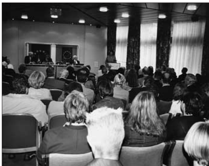
Ein auserwählter Kreis von über 100 Europaaktivisten und der Schuljugend des Salzkammergutes konnte am 6. Mai 2002 im Veranstaltungssaal des Thermenhotels (vormals Kurhotel) Bad Ischl von hervorragenden Referenten die aktuelle Situation in der Europäischen Union erfahren.

Diese unterscheidet sich jedoch sowohl quantitativ als auch qualitativ von den früheren. Zum einen verhandelt die