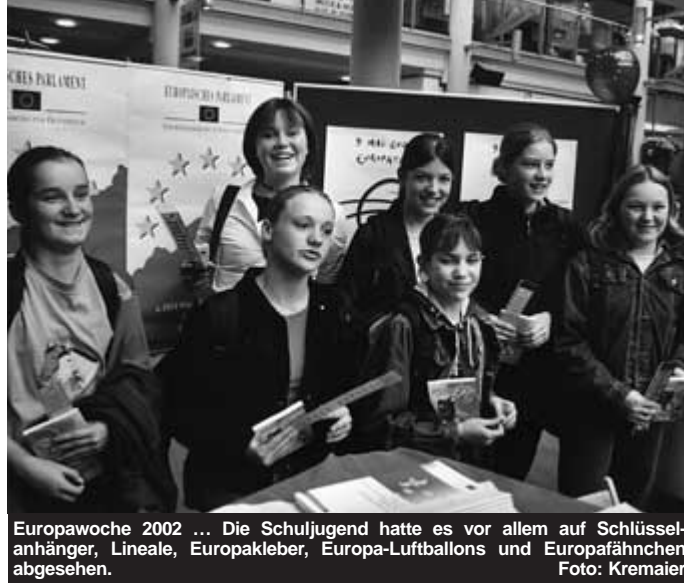
Europawoche 2002 ... Die Schuljugend hatte es vor allem auf Schlüsselanhänger, Lineale, Europakleber, Europa-Luftballons und Europafähnchen abgesehen.