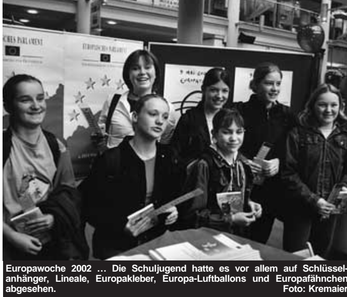
Europawoche 2002 ... Die Schuljugend hatte es vor allem auf Schlüsselanhänger, Lineale, Europakleber, Europa-Luftballons und Europafähnchen abgesehen.