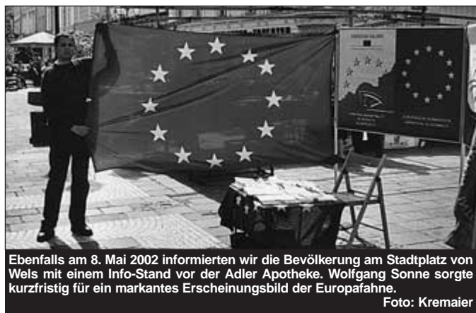
Ebenfalls am 8. Mai 2002 informierten wir die Bevölkerung am Stadtplatz von Wels mit einem Info-Stand vor der Adler Apotheke. Wolfgang Sonne sorgte kurzfristig für ein markantes Erscheinungsbild der Europafahne.