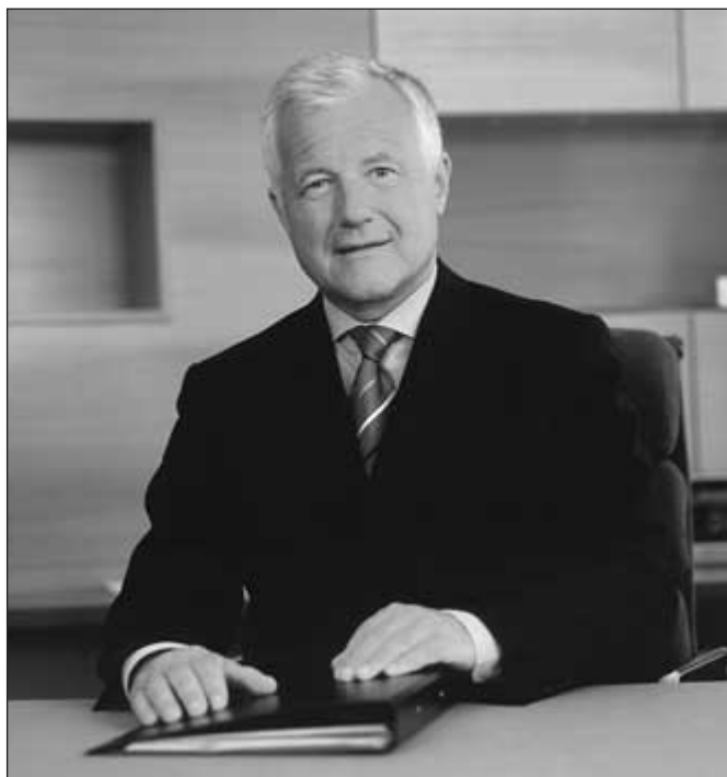
Dkfm. Franz Struzl, Vorsitzender des Vorstandes der voestalpine AG, Vorsitzender des Vorstandes der voestalpine Bahnsysteme GmbH

Vor diesem Hintergrund hielt sich der Erlöseinbruch in der voestalpine Stahl mit acht Prozent gegenüber dem Durchschnittsniveau des vorangegangenen Geschäftsjahres noch relativ in Grenzen. Die Rohstahlproduktion da-